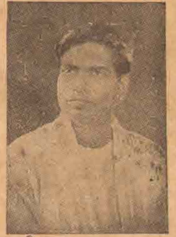
ஒவ்வொரு தமிழ் மகனுக்கும் வெடிகமல்லவா.

அன்றிலிருந்து இன்றுவரை தமிழரின் அரசியல் உலகமே காணாத, காணமுடியாத இத்தகைய ஒரு பெரும் தலைவர்களின் சிலையை நிறுவ எதிர்ப்பா? என்னே ஆச்சரியம்! ஆச்சரியமட்டுமல்ல