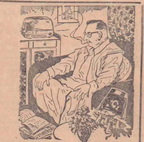
பணக்காரன் வரை எல்லோரும் புகைப்பது

கமலாபிடி ஒரு முறை வாங்கி உபயோகித்தால் அதன் உண்மை விளங்கும் கமலா ஸ்டோர்ஸ், செட்டியார் தெரு, கொழும்பு-11. தொலைபேசி: 3597-6322