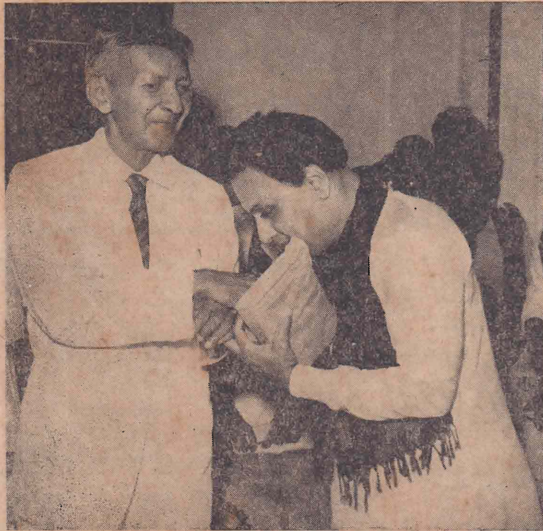
இலங்கை வந்திருந்த மக்கள் திலகம் திரு. எம். ஐ. ராமச்சந்திரன் தமிழரசுக் கட்டுதை திரு. சா. ஜே. வே. செல்வநாயகம் அவர்கள் இல்லத்துக்கும் சென்றிருந்தார். விடைபெற்றுத் திரும்புவகையில் தந்தையின் வகைய முத்தமிட்டபோது எடுக்கப்பட்ட படம்.

புத்தகம் 19 | திருவள்ளூர் ஆண்டு 1996 ஐப்பசி திங்கள் 22-ம் நாள் (7-11-1965) சூரியற்றுக்கிழமை | பக்கம் 12 | இதழ் 24