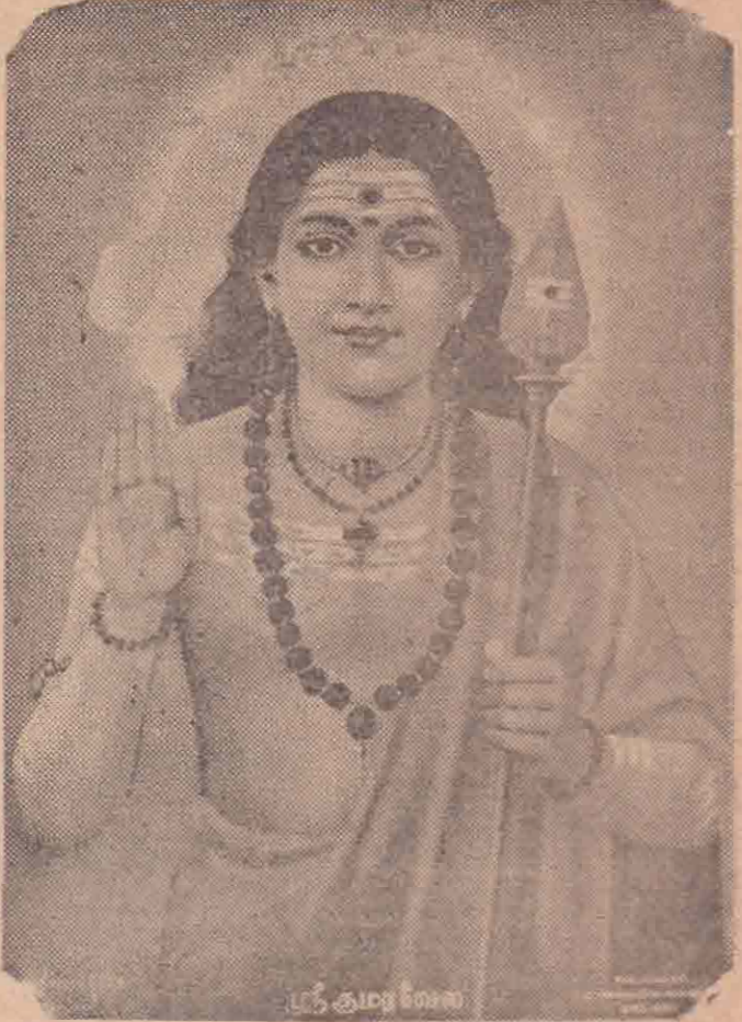
வில்லிநாயகப்பெருவழி வலவா—அங்கோர் வெற்பு நொறுங்கிப் பொடிப்பொடியானது வேலவா!—பாரதி

கடவுள் வளர்த்த கன்வித் தமிழைக்—காதலாடிக் கசிந்து கண்ணீர் மல்கத் துணை நிற்கும் தூய தமிழை