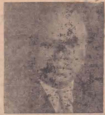
இவர் நடராசா அல்ல— "நடிக்காத ராசா"

இந்தப் போக்கு சில வேளைகளில் சிலருக்கு பிடிக்காமல் போனாலும்—யாருக்கும் திமை விளைவிக்காத நல்ல