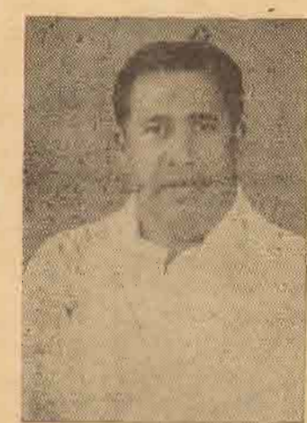
நியமன அமைச்சராகிய புதிய சரித்திரத்தைப் படைத்த வேளையிலும் அல்ல - காங்கேசன்துறை இடைத்தேர் தலை இடத்தைக் காரணமோ என்று நான் யோசிக்கிறேன்.

தபாலமைச்சர் நினைக்கிறார் என்பதைப் பற்றியே தான் கவலையுடன் எண்ணப்பார்க்கிறேன். முதலில் ஒழிக்கப்பட்ட சந்தர்ப்பத்தில் அல்ல - அல்லது இச்சபையில் முதலாவது தமிழ்