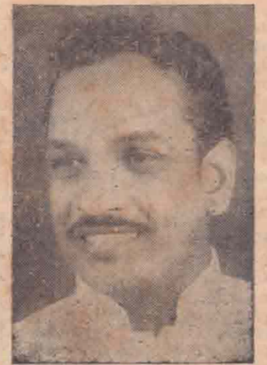
(4-ம் பக்கம் பார்க்க)

“எங்கள் கோரிக்கை ‘யாழ் தேஷ்’ ‘மட்டக்களப்பு தேஷ்’ ஆகவே — தமிழ் ஈழமே எங்கள் தாரக மந்திரம்! தமிழ் ஈழத்தின் தமிழக காண்ப் போராடுவதே தமது நோக்கம் —