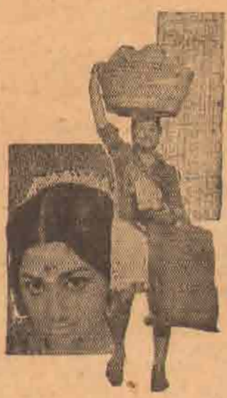
ராசி நல்ல ராசி உள்ளை மாலைபிட்ட மங்கை மகராசி.