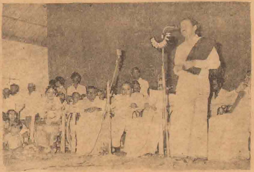
இராவிடக் கழகச் செயலாளர் திரு. வி. வீரமணி மணமக்களை வாழ்த்தும் போது.