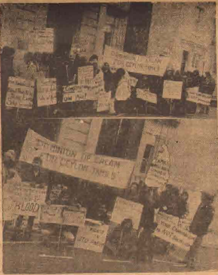
தமிழ் சமுதாய விரிவாக்கப்படுத்தி மீது உலகின் கவனத்தை திருப்புவதற்காக இலண்டனில் உள்ள தமிழர்கள் அகற்றப்பட்ட இலண்டன் தூதரகத்தின் முன்னால் 24 மணி நேரம் தொடர்ச்சியாக உண்ணாவிரதமிருந்த காட்சியை மேலே எண்ணிடுகிறார்கள்!