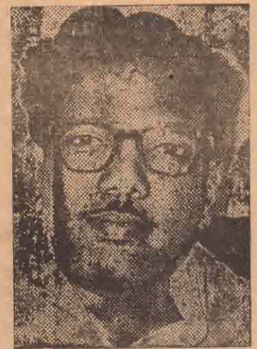
இந்திய ஒருமைப்பாடு முதலில்—மாநில சுயாட்சி இரண்டாவது என்ற அந்த

எவ்வளவு தழிவற்றிருக்கிறதென்று தவிர்ந்து தவிக்கிறேனடா தம்பி; ஆனால் அதிகாரமற்ற வகு இருக்கிறேன். நான் கிழைச்சாலைக் கைதியோல இருக்கிறேன். செய்யவேண்டிய காரியங்களைச் செய்ய முடியாமல் சூழ்நிலைக் கைதியாக ஆகியிருக்கிறேன். ஆகவே நான் என்னியவை களையெல்லாம் என் நாட்டு மக்களுக்குச் செய்யவேண்டுமோயானால் மாநிலங்களுக்கு அதிக அதிகாரங்கள் வேண்டும். ஆகவே நம்முடைய போராட்டம் நிறைவேண்டும்.