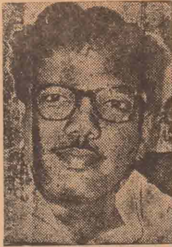
சுருக்கமாக—தமிழ் இலக்கியம்—மாறுதலின்—வளர்ச்சியின் முன்னேற்றத்தின் சின்னமாக இருக்கிறது.

நெற்றி நெரிப்புகள் இவ்வாத எனிய—உண்மையான மொழி அது!