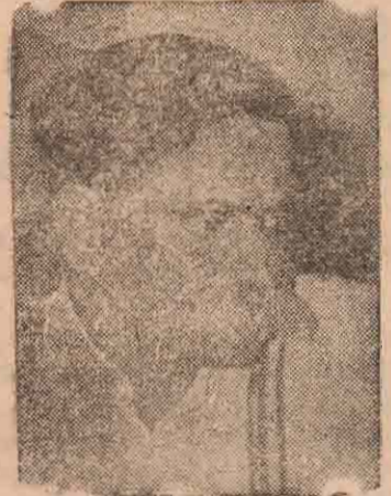
ம. பொ. சி. யின் ஆசிரியத் தலையங்கம்!

சட்டமானது, அந்த நாட்டிலுள்ள 30 லட்சம் தமிழ் இனத்தவரின் அங்கீகாரத்தைப்பெற்றதல்ல. அதனால், குடியரசு நாளை துக்கதினமாகக்கொண்டாடியிருக்கின்றனர் இலங்கைத் தமிழர்.