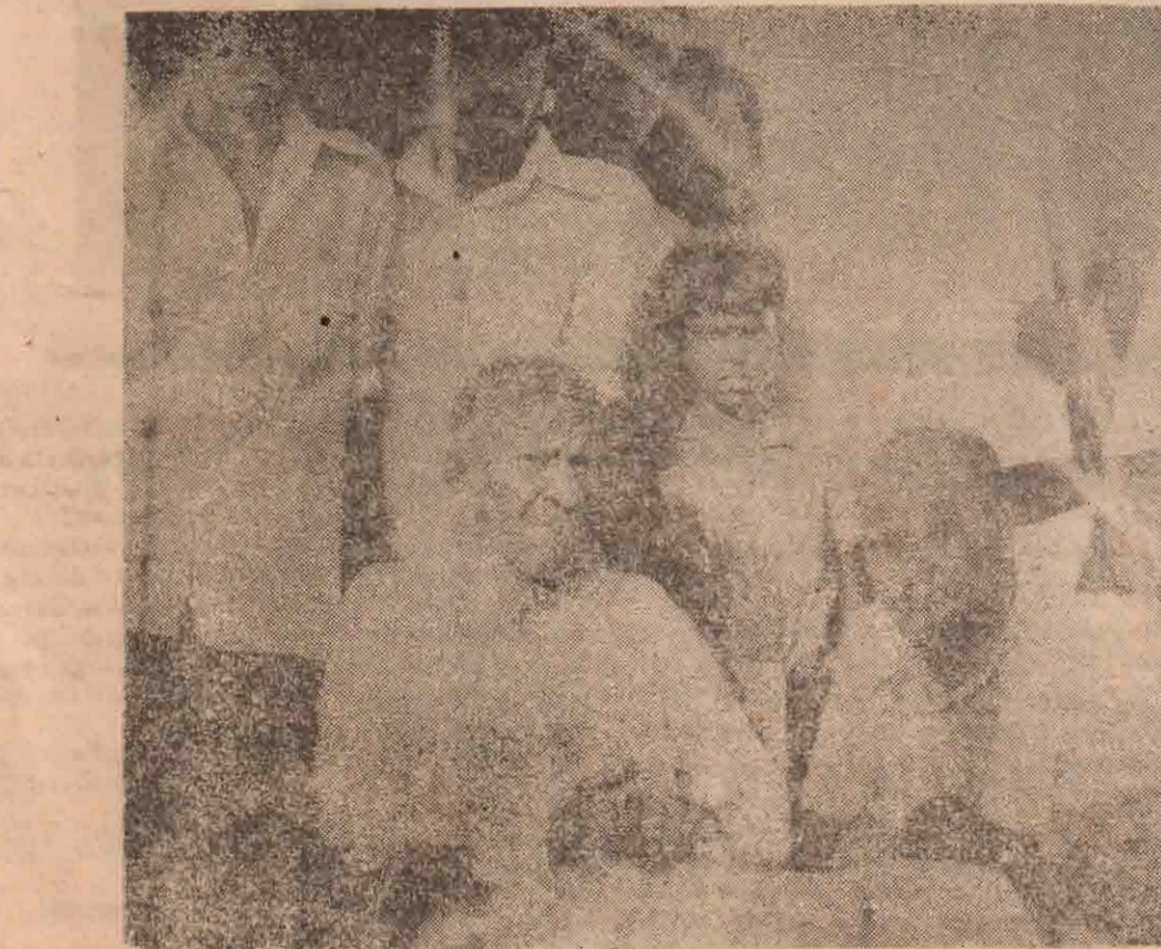
சட்டமன்றப் பேரங்காட்டில் தமிழர் தந்தை கழும் அமர்ந்திருக்கும் காட்சி!

இலங்கை, இந்தியாவின் அண்டை நாடு—குறிப்பாக, இந்தியத் தமிழகத்திற்கு நெருக்கமாகவுள்ள நாடு. ஆகவே, அந்த நாடு பல முள்ளதாக இருப்பதையே இந்தியா விரும்புகிறது. ஆனால் இலங்கையின் பலம் என்பது, சிங்களவர் ஆதிக்கம் அல்ல; தமிழரும் உள்ளிட்ட இலங்கை மக்கள் அனைவருடைய ஒருமைப்பாடாகும். இலங்கைவாழ் தமிழர்—ஆம்; இந்திய வமிசாவளித் தமிழரையும் சேர்த்து—சிங்களவரோடு ஒன்றுபட்டால்தான் இலங்கை பாதுகாப்பாக வாழமுடியும். பிரதமர் பண்டார நாயகர் இந்த உண்மையை உணரும் தான் எந்நாளோ?