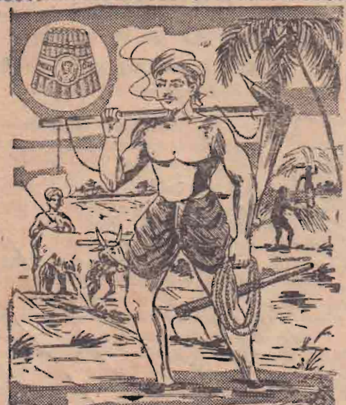
பாட்டாளி முதல் எல்லோரும் புகைர்பது