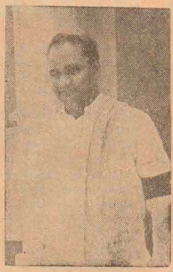
சிகளின் வாழ்வைச் சீர்படுத்துவதற்காக வல்ல. இவர்களின் இந்த கயநலப் போக்கினால் அப்பாவி மக்கள் பலியாகி வருகிறார்கள்.

“சிங்கள மக்களோடு தமிழ் மக்கள் சரிநிகர் சமானமாக வாழவே தமிழரசுக் கட்சி போராடி வருகிறது. சிங்கள மக்கள் ஆள்வோராகவும் தமிழ் மக்கள் ஆளப்படுவோராகவும் உள்ள நிலை மாறாமட்டும் நமது போராட்டம் ஓய மாட்டாது. தமிழினத்தின் வாழ்வில் இன்று இருள் சூழ்ந்திருக்கலாம் வடக்கு கிழக்கு மக்களைப் போல மலையகத் தமிழ் மக்களும் தமிழரசுக் கட்சியின் கீழ் ஒன்று திரண்டு போராட்டம் நடத்தினால் இழந்த உரிமைகளையெல்லாம் தமிழினம் மீட்டுக் கொள்ள முடியும்”