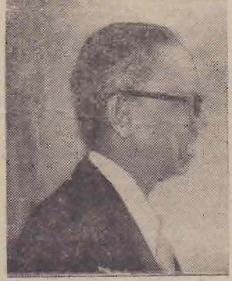
சட்டமேதை வி. எஸ். ஏ. புள்ளநாயகம்