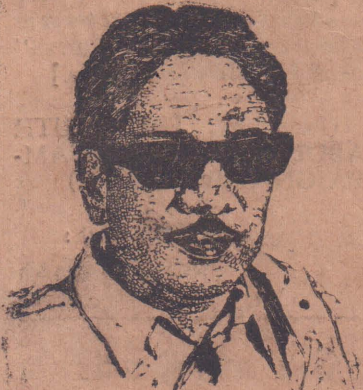
திராவிட முன்னேற்றக் கழகத்தலைவரும் கைக்கப்பட்ட தமிழக அரசின் முதல் வருமான டாக்டர் கலைஞர்

கருணாநிதி அவர்களும், ஏனைய பல தி.மு.க. தலைவர்களும் கைது செய்யப்பட்டுள்ளதாக நமக்குப் பிந்திக் கிடைத்த செய்திகள் கூறுகின்றன. ஆயினும் இச்செய்தியை உறுதிப்படுத்த முடியவில்லை.