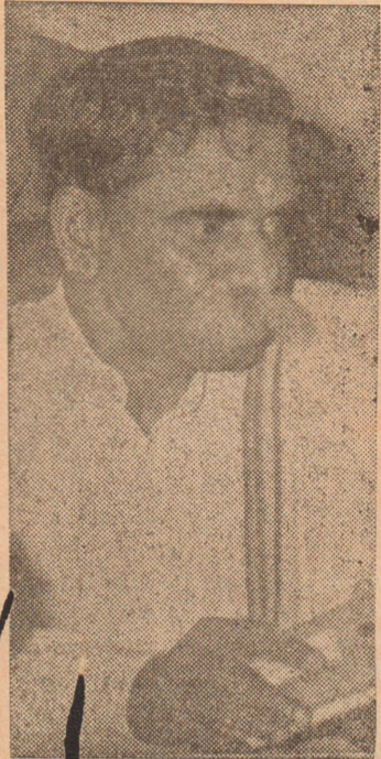
ரணை நடத்த ஒரு கமிஷனை நியமித்தார்—அவ்வளவு தான்! அந்த கமிஷனின்