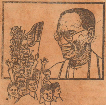
OFFICIAL FIRST DAY COVER

ஐக்கிய முன்னணி அரசின் தமிழ் ஒழிப்புக்கு உதாரணம் இதோ!