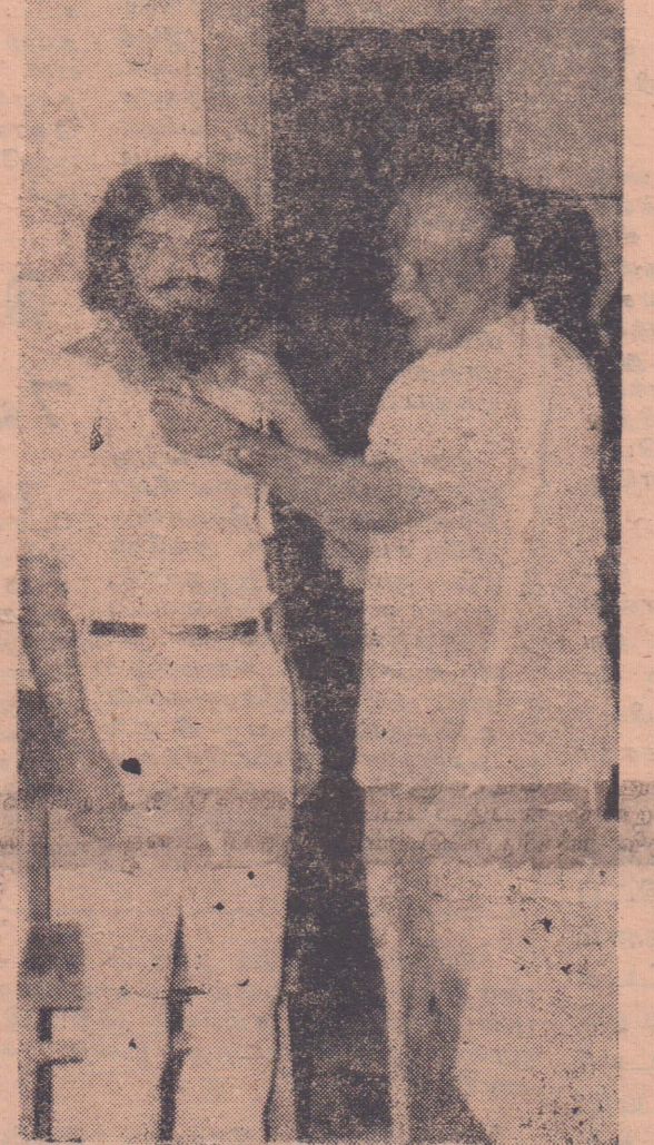
தமிழ்ஈழ விடுதலைப் போராட்டத்தில் சிறைசென்று மீன்-இயக்க வீரரான இளைஞர் ஒருவருக்கு விடுதலை இயக்கத்தின் தளபதி தலைவர் அவர்கள் மீழ்ச்சி பொங்க உதயசூரியன் சால்வை போர்த்தி வரவேற்கும் காட்சி இது!

தமிழ் இனத்தின் விடுதலைப்போராட்டம் பலருக்கு வெறும் அரசியலாகமட்டுமேயிருக்கிறது; அண்ணன் அமிர்தலிங்கத்துக்கும், அவரது தலைமையை ஏற்கும் தமிழ் இளைஞர்களுக்கும் இன விடுதலைப் போராட்டம்— சொந்த வாழ்க்கைப் போராட்டமாக இன்றைக்கு இருக்கிறது! சொந்த வாழ்க்கையிலிருந்து பிரித்து இயக்கத்தை தனியே வைக்க