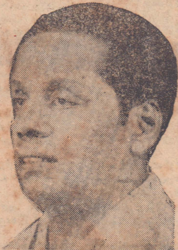
மனதில் தேப்பெண்ணைகளை ஏற்படுத்தியுள்ளது. அதை நான் தெளிவுபடுத்தவிரும்புகிறேன்.

எழுத்துச் சுதந்திரம், பத்திரிகைச் சுதந்திரம் பேச்சுச் சுதந்திரம் ஆகியவற்றை பாதுகாக்கின்ற வகையிலும் சட்டமறுப்பு இயக்கம் அமைய வேண்டுமா என்பதை ஆராயும் படியும் கூட்டணியின் சட்ட மறுப்பு இயக்கக் குழுவை நடவடிக்கைக் குழு பணித்திருக்கிறது.