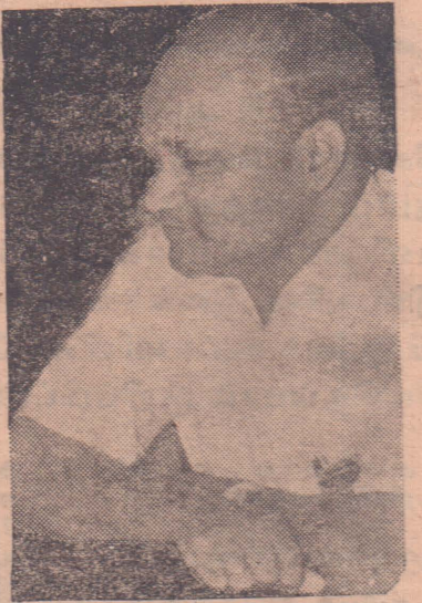
தமிழர் தளபதி அமிர்