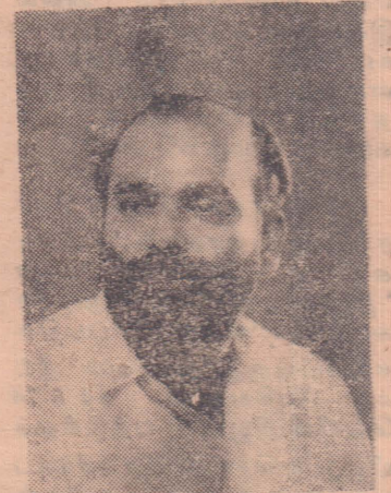
கடமை வீரர் நவம்