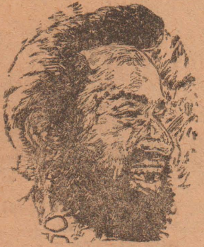
உணர்ச்சிக்க கவிஞர் காசி ஆனந்தனின் பிறந்த நாள் விழாவை தமிழர் கட்டணி

கொழும்பில் காசி ஆனந்தன் பிறந்த நாள் விழா!