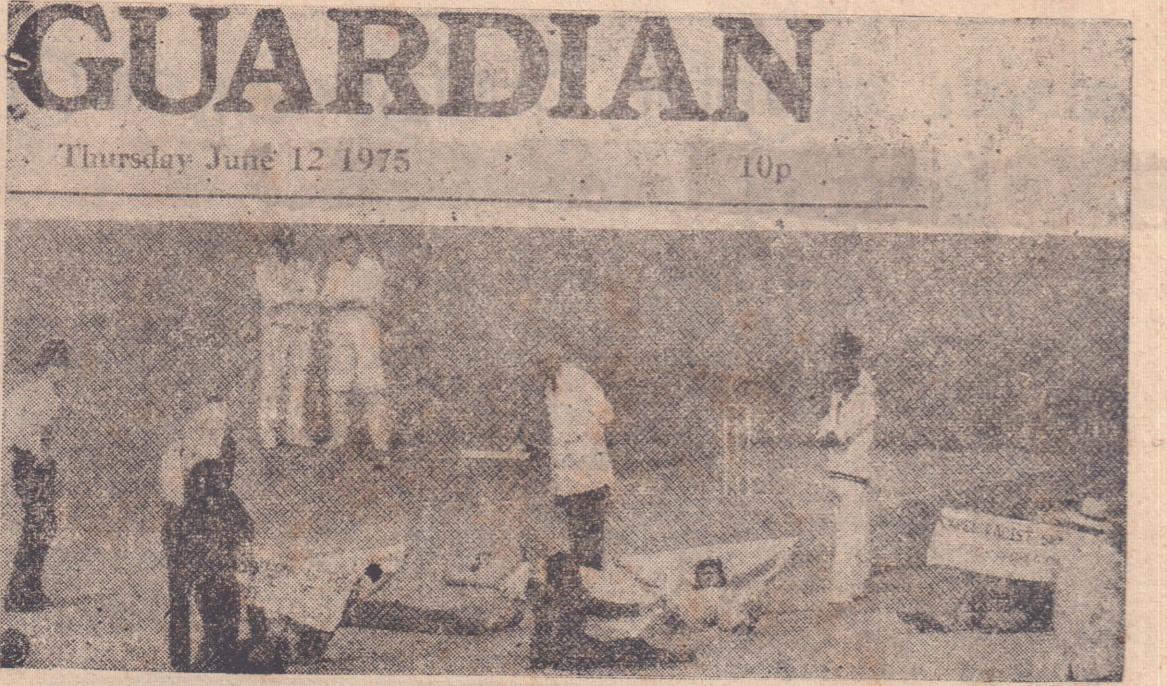
Demo Stops Play: Banner-carrying demonstrators lie on pitch holding up play between Australia and Sri Lanka at the Oval yesterday. The Tamil demonstrators were protesting about the enforced integration of their culture with the Sinhalese — மேற்கண்ட குறிப்புடன் கார்டியன் ஏடு வெளியிட்ட படமே மேலே தரப்பட்டுள்ளது.

இலண்டனிலுள்ள பி.பி.சியும் டெலிவிசன் நிலையமும் இந்த நிகழ்ச்சிகளுக்கு போதிய விளம்பரம் கொடுத்துள்ளன. (இது சம்பந்தமான மேலும் விரிவான செய்திகளை 3ம் பக்கத்தில் காணலாம்)