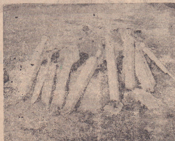
இடிந்து போய்க் காணப்படும் தமிழ்த் தியாகிகளின் நினைவுச்சின்னம் இதுதான்! இதேயிடத்தில் இந்திய நினைவுச் சின்னத்தை தமிழர் கூட்டணியினர் நிறுவவிருக்கின்றனர்.