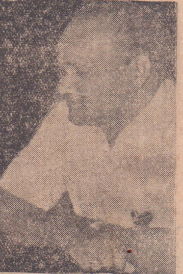
செயலாற்றுவதற்கான உடனடி நோக்கம் நிறைவேறும்!" - வழக்காய் கருத்தரங்கில் நாவலர் அமிர்

திருப்பியுள்ளனர். தமிழ் இளைஞர்கள் விரக்திமேலீட்டினால் செய்யும் செயல்களுக்கு இந்த அரசாங்கத்தின் தமிழ் விரோதக்கொள்கைகளே காரணமாகும். "தமிழ் இளைஞர்கள் இந்த அரசின் வன்செயல்களுக்கு ஒருபோதும் பயந்து விட மாட்டார்கள். தமிழ் மக்கள் தம்மைத் தாமே ஆளுவதன் மூலமே எமது பிரச்சினைகளைத் தீர்த்துக்கொள்ள முடியும் என்கிற நம்பிக்கை இளைஞர்களிடையே வளர்ந்து வருகிறது. "இந்த அரசு எடுக்கும் ஒவ்வொரு நடவடிக்கையும் எமக்கும் எமது இயக்கத்திற்கும் பெரும் வெற்றியையே அளித்துவருகிறது. இளைஞர்கள் கட்டுப்பாடாக ஓர் இயக்கத்தின் கீழ் ஒரே தலைமையின் கீழ் - ஒன்று படிக