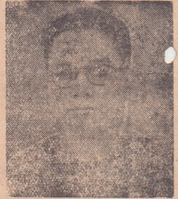
யேற்றப்படுவதையும் திட்டமிட்ட சிங்களக் குடியேற்றத்தையும், தரப்படுத்தலால் தமிழ்மாணவர் பாதிக்கப்படுவதையும், தமிழரது நிலங்கள் பரிசீலிக்காமலும் எண்ணி இரத்தக் கண்ணீர் சிந்தியவர் அமரர்” என்றும் “அவரின் கொள்கை வழி நின்று தமிழீழம் காண்பதே நாம் அவருக்குச் செய்யும் கைமாறென்றும்” குறிப்பிட்டார்.