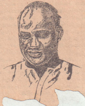
சுதந்திரன் தலைமுறை நடமாடும் அந்த உரிமைப் போராட்டப்பொறுப்பு மாரி கிறது.

பொருளாதார சித்தாந்தத்தில் தெளிவான சிந்தனையில்லாத தலைவர்களிடம் தமிழ் பேசும் மக்களின் உரிமைப்போராட்டம் ஒப்படைக்கப்பட்டிருந்த காலம் ஒன்றிருந்தது உண்மையே. ஆனால் இப்பொழுது அந்நிலை முற்றிலும் மாறி