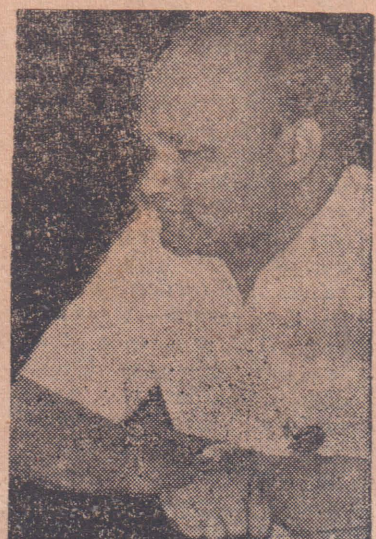
நாட்டு தூதராலயமொன்றைச் சேர்ந்த ஒரு பிரமுகர் -5-ம் பக்கம் பார்க்க

"தமிழ்ஈழம் வேண்டுமா, வேண்டாமா எனும் நிலைகடந்து - தமிழ்ஈழத்தை எப்படிக் கட்டி அமைத்தே தீருவது என்று தீர்மானித்து - அப்படி நாம் அமைக்கப் போகின்ற தமிழ்ஈழத்தின் ஆட்சிமுறை எப்படி இருக்க வேண்டுமென்று ஆலோசிக்கும் நிலைக்கு இன்று நாம் வந்து விட்டோம். இன்று என்னைச் சந்தித்த வெளி