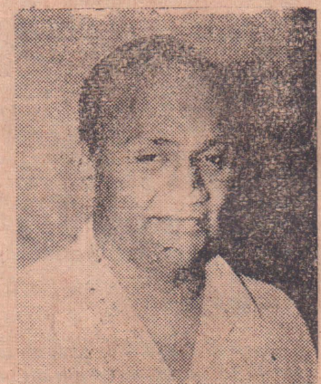
—மேற்கண்டவாறு வெளிநாட்டு செய்தி நிருபர்கள் மாநாட்டில் உரைநிகழ்த்திய தமிழர் விடுதலைக் கூட்டணி செயலதிபர் நாவலர் அ. அமிர்தலிங்கம் அவர்கள் திட்டவாட்டமாக குறிப்பிட்டார்.

“அஹிம்சை வழியில் - சமாதானமாக எங்கள் தமிழ் ஈழத்தை அமைத்துக்கொள்ளவே விரும்புகிறோம். தமிழ்பேசும் மக்களின் இதய வேட்கையைப் புரிந்துகொண்டு சிங்கள அரசு இதற்கு இணங்கிவருமானால்- இரத்தம் சிந்தாமல் இரு இனங்களும் இத்தீவில் சுதந்திரமாக வாழ வழி ஏற்படும். சமாதானமுறைகள் தோல்வியுறுமானால், உலகிலுள்ள ஏனைய விடுதலை இயக்கங்களைப்போலவே, நாமும் நமக்கு உதவக்கூடிய வெளிநாடுகளிடமிருந்து உதவிபெற்று தீவிரமாகப் போராடி எங்கள் சுதந்திரத்தை எப்படியும் நிலைநாட்டியே தீருவோம்!”