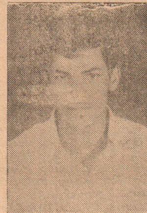
எனது சொந்த லொறியிலேயே கிளினராகக் கடமைபுரிந்தார்.

47 வயதான இவர் யாழ். வண்ணார்ப்பண்ணையைச் சேர்ந்தவர் அநுராதபுரம் நிறைவேற்றுப் பொறியியலாளர் அலுவலகத்தில் பிரதம இலகிதராகப் பணி புரிந்தவர். 18-8-77 அன்று அநுராதபுரம் கச்சேரிக்கு காலை 8 மணியளவில் சென்ற போது, அங்குள்ள சிங்கள ஊழியர்கள் உடனே இடத்தைக் காலிசெய்யும்படி கூறினார்கள் இனக்கலவரத்தைக் கேள்விப்பட்டோர். தமது இருப்பிடத்திற்குத் திரும்பி வந்து புகையிரத நிலையத்திற்குச் செல்லும் வழியில், அநுராதபுரம் சந்தைக்கு முன்னால் வைத்து, காடையர்களினால் கல்லெறிபட்டும், கத்தியால் குத்தப்பட்டும் மிகப்பயங்கரமான முறையில் ஸ்தலத்திலேயே மரணமடைந்தார். இவ