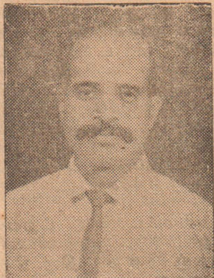
ரது உடலைக்கூட யாழ்நகர் கொண்டுவர முடியவில்லை.

—க. மகேந்திரராசா மானிப்பாய் மேற்கு மானிப்பாய்