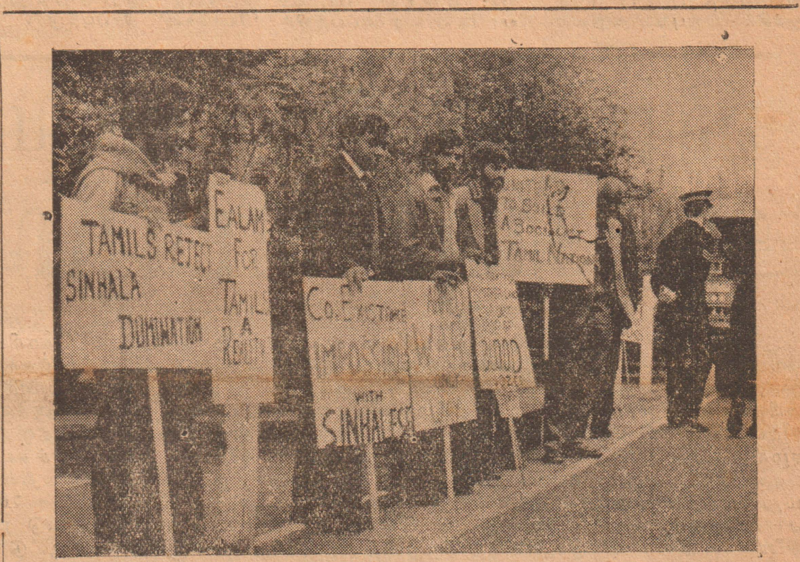
லண்டன் இலங்கைத் தூதரகத்தின் உள்ளே இலங்கை வெளிநாட்டமைச்சர் ஐஐபி. ஹமீத் பத்திரிகையாளர் மாநாடு நடத்திய சமயம் தூதரகத்துக்கு வெளியே ஈழத்தமிழ் விடுதலை இயக்கங்களின் பிரதிநிதிகள் ஆர்ப்பாட்டம் நடத்திய காட்சி இது.

வர்களும், முக்கிய பிரமுகர்களும் உரையாற்றுவார்கள். அண்மையில் லண்டனில் கருணாநிதியை விடுதலை செய்யக்கோரி இந்திய தூதரகத்தின் முன்னால் நடைபெற்ற ஆர்ப்பாட்டத்தில் ஈழத்தமிழர் அமைப்புக்களான லண்டன் ஈழ விடுதலை முன்னணியும் தமிழர்நடவடிக்கைக் குழுவும் கலந்துகொண்டு இந்திய தூதரகக்கு மகஜர் சமர்ப்பித்திருந்தது என்பதும் குறிப்பிடத்தக்கது.