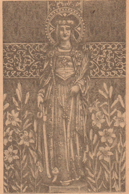
முகமால அர்ச். பிலோமினம்மாள் திருநாள்