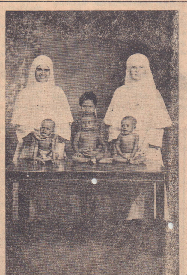
அனாதர் விடுதியில் கன்னியர்