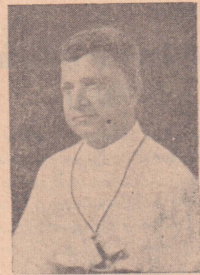
இலங்கையின் அமலோற்பவ பரித்தியாகிகளின் புதிய சிரேஷ்டர்

மான குரல்தொனியில் எவ்வித மாறுபாடும் இருக்கவில்லை. ஆயினும், ஒவ்வொரு வார்த்தைகளையும் உச்சரித்தபின் மூச்சு இழுப்பதற்காகச் சிலவிடிகள் கஷ்டப்படுவது நன்கு புலனாகியது. பாப்பரசர் தரிசனையளிக்கும் போது பின்பக்கமாகத் தொங்கிய ஊதாவர்ணத் திரைகளின் மறைவில் பாப்பரசரின் குடும்ப வைத்தியர் நின்றவண்ணம் பரிசுத்த தந்தையின் ஒவ்வொரு அசைவையும் அவதானித்துக்கொண்டிருந்தார்.