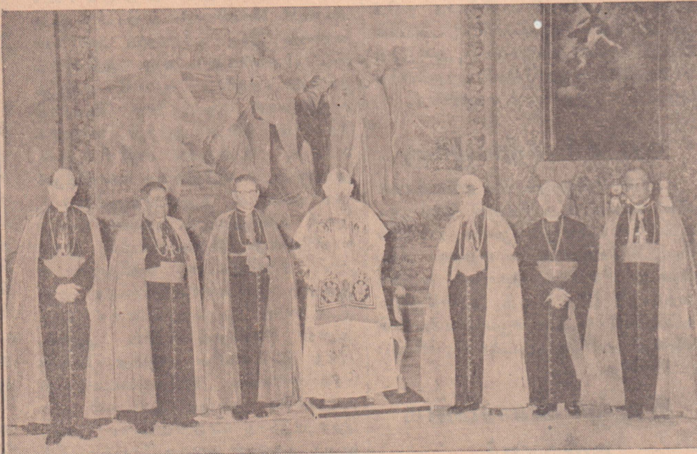
பரிசுத்த பாப்பரசர் வத்திக்கான் சங்கத்தில் கலந்துகொண்ட இலங்கை ஆயர்களுக்கு கார்த்திகை 26ஆம் தேதி தமது வாசஸ்தலத்தில் பிரத்தியேக பேட்டி அளித்தபோது பிடிக்கப்பட்ட படம்.