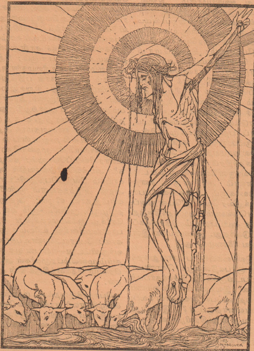
"எங்களுடைய சீவியத்தில் உமது இரட்சணியத்தின் பலனை அனுபவிக்கும் பொருட்டு..." கிறிஸ்துவின் பாடுகளின் பலன்களைப் பகிர்ந்து கொடுக்கிறார் குரு.

உலகசமாதானத்துக்குத் திறவுகோலாகக் கருதப்படுகின்ற ருஷியாவின் மனந்திரும்புதலானது முன்னர் எக்காலத்திலும் பார்க்க இப்போது அதிகம் நெருங்கியிருப்பதாகக் கருதினால்திருச்சங்கதலைவரான கருதினால் திசரூன் ஆண்டவர் கூறுகின்றார். இதற்குக்காரணம், சமயத்தை அடக்கியொடுக்கிவிடுமாறு செய்யப்பட்ட கம்யூனிஸ்தர்களின் தந்திரகூழ்ச்சிகளெல்லாம் அவர்களுக்கே கெடுதியாகத் திரும்பியிருப்பதே யாகுமென்று அவர் எண்ணுகின்றார். ஐக்கிய அமெரிக்க தேச லீலப் படைச்சஞ்சிகைக்கு அவர் எழுதியுள்ள கட்டுரை ஒன்றிலே, "சைபீரியாவிலுள்ள சுரங்கங்களில் வேலை செய்யுமாறு பலவந்தமாக மேற்றிராணியாரையும், குருமாரையும் அனுப்பிவைத்தமை போன்ற அவர்களின் நடவடிக்கைகள் திருச்சபையை அதிகஞ்சிறந்த வகையிலே அங்குபிறர் அறிந்துகொள்ளச் செய்வதான பெருஞ்சேவையை ஆற்றியிருக்கின்றன; இந்தவிதமாகச் சமயத்