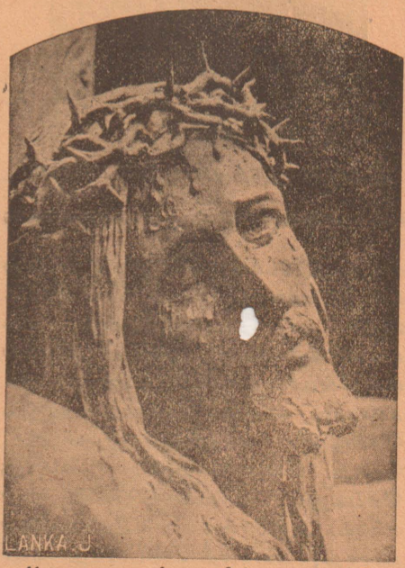
“நமது ஆண்டவரின் மரணத்தின் இரகசியத்தை நீங்கள் நிறைவேற்றுகிறதால்.....”