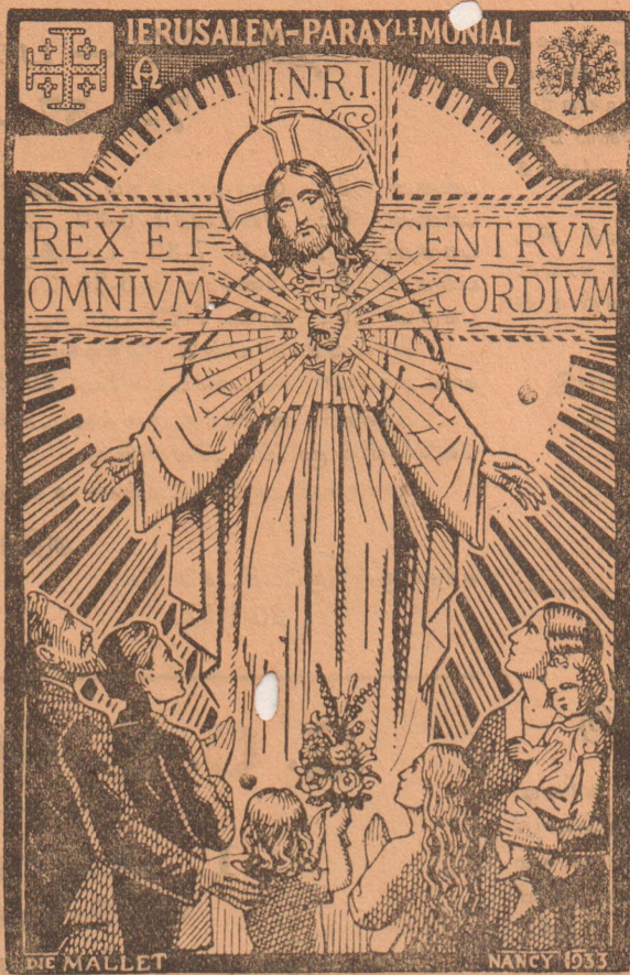
"உங்களுடைய போதகத்தாலும், நடத்தையாலும் சருவேசரனுடைய குடும்பமாகிய ஆலயத்தை ஸ்தாபிக்கும் பொருட்டு....."