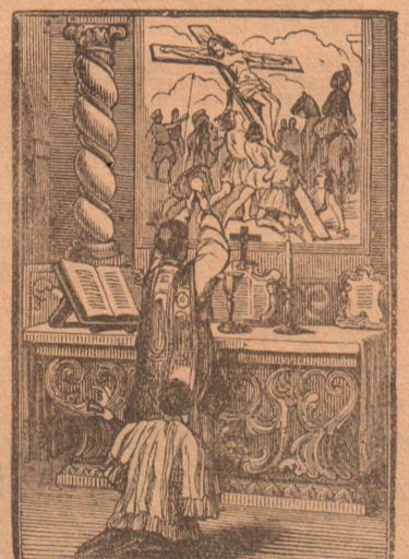
இதுவே குருத்துவத்தின் மகிமை!

யைத் தீர்க்காதிருக்கின்றீர்? உமது நாட்டு மக்களுக்காக உமது சீவியத்தை — வாழ்ப்பாட்கள் அனைத்தையும் கடவுள் சேவைக்கு அர்ப்பணஞ்செய்ய ஏன்பின்வாங்குகிறீர்? நேசதேவனுக்காகவும், தாய்நாட்டுக்காகவும் உந்த சேவைபுரியச் சந்தர்ப்பமளிக்கப்பட்ட போது பின்வாங்குவதும், தாமதஞ்செய்வதும் உண்மைவீரனின் குணமல்ல. அச்சேவையின் கஷ்டங்களைப் பாராது, சுயநலத்தைப்பாராது நேரிடக்கூடிய இன்னல்களைப்பாராது, முழு மனதோடும், முழுச்சம்மத்தோடும் தன்னைத்தானே அச்சேவைக்கு அளிப்பதுதான் ஓர் உண்மையானவீரனின் ஆண்மை. சிலர் இத்தகைய சேவையை ஓர் சிலுவையென்று கருதலாம். ஆம், ஓர் சிலுவையேதான். சிலுவையைச் சமந்து கல்வாரியில் மரித்து முன்றும் நாள் மகிமையுடனும், மகத்துவத்துடனும் தேவன் உயிர்த்தெழுந்தார். தமது மரணத்தால் அஞ்ஞானத்தை