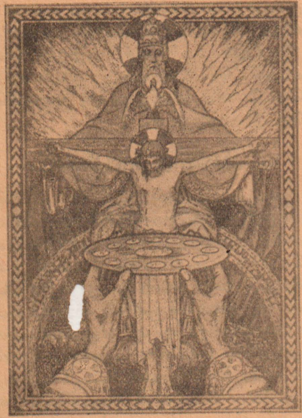
குரு இன்னொரு கிறிஸ்து

“சீவியர்களுக்காகவும், மரித்தவர்களுக்காகவும் பூசை நிறைவேற்றும் வல்லமையையும் பெற்றுக்கொள்ளும்.”