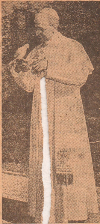
தமது மிகையிலே ஓர் செல்லப் பிள்ளையோல் நடமாடும் பட்சி ஒன்றுடன் பாப்பரசர் சிறிதுவேளை பொழுது போக்குகிறார்.

தன் சொந்த நலனைப் பாராட்டாமல் சமுதாயத்துக்காக உழைக்கிறவன் அதிகஞ் செய்கிறான்.