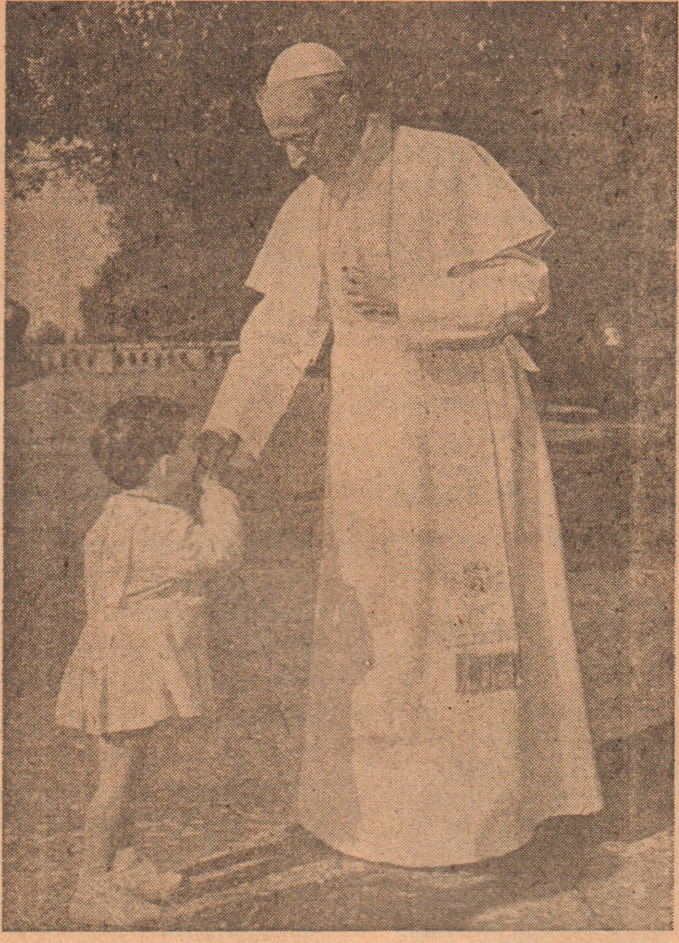
நிகழும் பங்குனிமீதம் 2-ந் திகதியன்று தமது 81-வது பிறந்த பெருநாளைக் கொண்டாடிய 12-ம் பத்திநாத பாரபரசர் ஓர் பாலியனுக்குப் பேட்டியளித்துத் தமது கண்ணியாயை முத்தமிடக் கொடுக்கின்றார்.

கந்தளாய்ப்பகுதியிலே எண்ணூயிரம் ஏக்கரில் தட்டில் கரும்பு செய்கைபண்ணுவதற்கு ஒன்பது லட்சம் ரூபாய்க்கோரும் உபமான்யப் பிரேரணை ஒன்றை உணவுமந்திரி பிவிப்பகுணவார்த்தனா சனப்பிரதிநிதிகள் சபையில் சமர்ப்பித்திருக்கிறார். இந்தக் கரும்புச்செய்கைத் திட்டதின் கீழ் மூன்று வருட காலத்தின் பதின்மூன்று மாதல் பதினெண்ணூயிரம் தொன் சீனிசெய்வதற்குத் தேவையான கரும்பைச் செய்காம்காட்டுவதில்லை; இவர்கள் ஸ்தானி