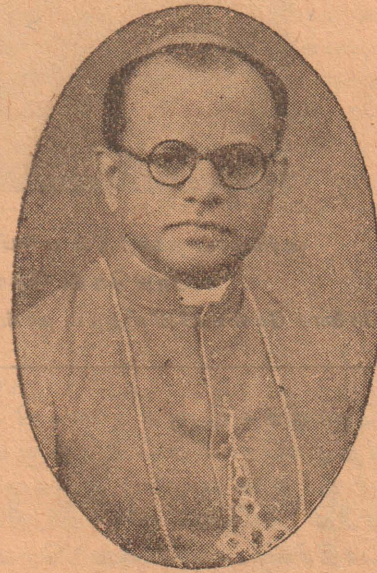
சமாகமத்தை ஆரம்பித்து வைத்தார்