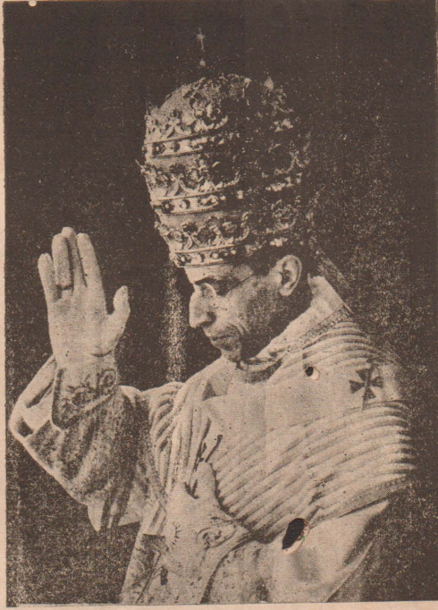
பரிசுத்த தந்தை பன்னிரண்டாம் பத்திராதர்

கத்தோலிக்க பொதுமக்களெல்லாரின் சார்பாக—காவலன் புதிய முதந்தமிழ் ஆயருக்குத் தனது இருதயபூர்வமான வாழ்த்தையும் வணக்கத்தையும் சமர்ப்பிக்கிறது!