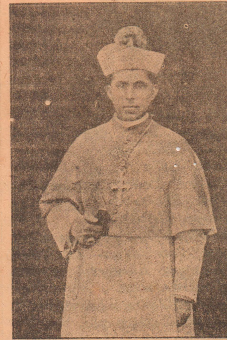
சலாப மேற்றிராணியார் மிகவந். எம்மன்டீரியில் O. M. I. ஆண்டவர் அவர்கள்

யாகும். இவர்களில் இப்போது இரண்டுலட்சம்பேர் மாத்திரம் கத்தோலிக்கரா யிருக்கின்றனர்.