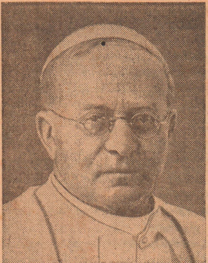
பரிசுத்தநந்தை 11-ம் பத்திரகம்

பிரான்சினிலே ஶ்ரீது எனும் புண்யபதி போன்றதுவாய் போரன இத்தாலிப் பெயரிய லொற்றோ பதியும் போர்த்துக்கால் தேசமதில் போற்று பத்திமா பதியும் போன்றிலங்கு வேறு திருத்தாயின் சீர்பதியும் என்னுமிவை போன்று எங்கள் லங்கை நாட்டினிலே வன்னிமடுப்பதியும் மாட்சிபெற்ற தம்மாளை அருளப்பர் என்னுந்ல ஆண்டவ ராம் கியோமர் திருநகரம் ரேமைத் திருப்பதிபோய்ப் பாப்பரசர் அரியதரிசனையை ஆதரவாய்ப் பெறுந்தருணம் பரிவாய் மடுப்பதியின் பயன்களெல்லாம் கேட்டறிந்து நல்லதந்தை பாப்பரசர் செல்விநல்ல மடுத்தாய்க்கு வல்லசெய்யலை யொன்றை நல்மனமா யீந்தனரே ஆயிரத்துத் தொள்ளாயிரத்து ஆனநாற்பத் தெட்டாண்டில் தாயுடையமாதம் தனில் ஶந்தாம் தேதிதனில் மடுத்தாயார் நம்முடைய மக்களையே பார்ப்பதற்காமி விடுத்தேதம் நற்பதியை விருப்புடனே பவனியுடன் யாழ்நகர்மேற் சனத்தில் நாடுங் கிராமமெல்லாம் வாழ்த்தித்துதிட்டவே வந்துசென்ற ஶம்மாளை மனந்திருப்பத வியக்கம் மாறாத ஞாபகமாம் வனத்தரசி தந்தசெய் மாலைப்பத்திப ரவியதாம் மங்காத கீர்த்தி மகிமைப் பிர தாபமுள்ள துக்க மருதமடு துலங்கவழி செய்ததிரு அமலோற் பவியின் அரியருநக் கருடைய சமயோசித சேவை சரித்திரத்தில் காணலாகும் முதலிற் தமிழ் ஆயராக முந்திவந்த கோபாலன் பதம் புகழு மெயிலியானுல் பார்த்திபன மிவரும் ஆயிரத்துத் தொள்ளாயிரத்து ஆனநாற்பத் தொன்பதிலே தாயின் முடிபுனைந்த தனிவெள்ளி யூபிலியாம் மேற்றூணி மாறெழுமார் மேவியே வந்திடுவர் நூற்றுக்கு மேலான நூற்குருக்கள் வந்திடுவர் எண்ணுக்கடங்காத எங்கெங்குங் காணாத தொண்டர் திரள்திரளாய்த் தோத்திரிக்க வந்திடுவர் செல்ல மடுப் பதியில் சொகுசுடனே வீற் றிருக்கும் தொல்லை நீக்குந்தாயார் துயர் நீக்கித் துணைதருவார் ஶரீர்திக்கும் வாராமல் உத்தமிகாப் பாற்றிடுவார் சீராக நம்பிடுவீர் செகத்திலுள்ள மானிடரே .