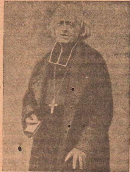
அமலோற்பவசபை ஸ்தாபகர் அதி ஆசாரமிக்க இயூஜின் டெ மகனேட் O. M. I. ஆண்டவர் அவர்கள்

தலையே! நீ வணங்காய்—தாளிற் சந்திரனை யணிந்து நிலையாய் மாமடு மீதுறை தாயாரைத் தலையே நீ வணங்காய்! கண்காள்! காண் மின்களோ—கரை காணச் சமுத்திரமாம் பண்பார் தேவனை ஈன்ற பிராட்டியைக் கண்காள் காண் மின்களோ! செவிகாள்! கேண் மின்களோ—செப மாலைத் திருத்தாயார் புவிமீது செய்யற் புதந்தனை நாடொறுஞ் செவிகாள் கேண் மின்களோ! மூக்கே! நீ முகராய்—முது காணுறை முன்னவளை வாக்கால் யாவையு மாக்குப வன்தாயை மூக்கே நீ முகராய்! வாயே! வாழ்த்திடுவாய்—மடு வாழும் மரியானைச் சேயோருக்கருள் செய்யுங் கிருபையை வாயே வாழ்த்திடுவாய்! நெஞ்சே! நீ நினையாய்—நிறை நிர்மல உற்ப வியாம் செஞ்சோதி யுடைத் தெய்வீக தாயினை நெஞ்சே நீ நினையாய்! கைகாள் கூப்பித் தொழீர்—கனல்