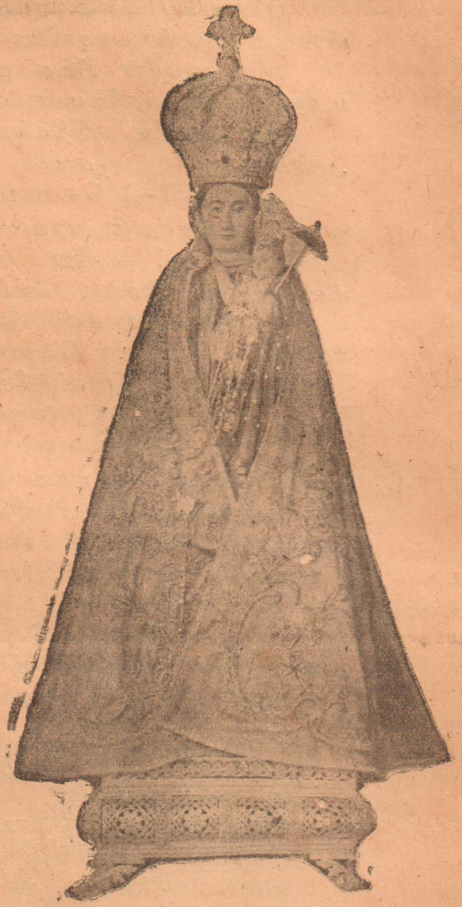
மருதமடுச் செபமாலேநாயகி திருச்சருபத்தின் உண்மைச் சாயல்

பலவகைப்பட்ட இகலோக — பரலோக — நன்மைகளைப் பொழிந்தருளும்படி, சருவேசரன்கருவியாய்க் கொண்ட தி ருச்சருபம். ஆண்டாண்டுதோறும் ஆயி ரம், பதினாயிரம் யாத்திரிகளை கத்தோ லிக்கர்மாதிராமல்ல, புத்தர், சைவர்மக மதியர், பதிதர், ஆதியபலபுறசமயத்தவர் களைத்தானும் தனது திருப்பாதத்தண் டை கவர்ந்திழுப்பதாகிய காரணயமிக்க சருபம். சமார் முன்னூறு வருடங் களின்முன் இச்சருபத்தை வைத்து வணங்க, கானகத்தில் பிரமாண்டமான ஆலயமிருக்கவில்லை. அதைச்சுழுவா, தேவதோத்திரகிதங்களைப்பாடி அஞ் சலிசெய்ய — குருக்கள், சந்நியாசிகள் கூட்டம் அந்தக் காட்டில்வந்து கூடவு மில்லை. திருச்சருபம்மறைவாய்வைக் கப்பட்ட இடத்தை யறிந்திருந்த ஒரு சிலரே அவ்விடம் ஒளித்துவந்து, தங் கள் துன்பதூரிதங்களை அத்திருச்சரு பத்தின் பாதத்தண்டையிற் சொல்லி ஆறுதலடைந்தபோவார்கள்.