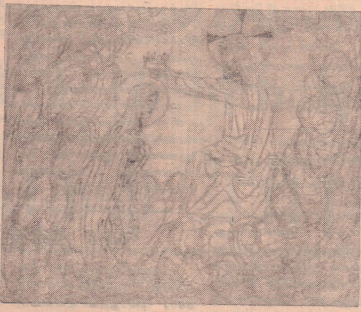
“அரசியான புனித மரியாள்”