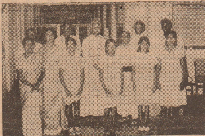
பொதுநிலையினரின் ஆணைக் குழுவால் நடத்தப்பட்ட கவரொட்டி, கவிதைப் போட்டிக்கான பரிசில்களைப் பெற்றவர்களுடன் யாழ். ஆயரும், ஆணைக்குழு தலைவரும், மறைவட்ட முதல்வரும், பொதுநிலைய ஆணைக்குழுவினரும் இணைந்து நிற்பதைக் காணலாம்.

கேரளத் திருச்சபைகள் சங்கமும், இந்திய ஒத்தடொக்ஸ் சீரிய திருச்சபையும் ஆர்மேனியாவில் பூகம்பத்தினால் ஏற்பட்ட பெரும் அழிவுகளைப்பிட்டு ஆழ்ந்த கவலை தெரிவித்துள்ளன. நிவாரணப்பணிக்காக கேரளத் திருச்சபைகள் சங்கம் ரூ.100/- அளிக்கத் தீர்மானித்துள்ளது. இந்திய ஒத்தடொக்ஸ் சீரிய திருச்சபை ரூ.1,00,000/-வும் மத்திய கேரள மாவட்ட தென்னிந்தியதிருச்சபை ரூ.10000/-வும் நிவாரண நிதிக்கு அளித்துள்ளன. கத்தோலிக்க ஆயர் பேரவை ஜனவரி 16-ம் திகதியன்று 2,00,000/- ரூபாவை நிவாரண நிதிக்கு அளித்துள்ளது.