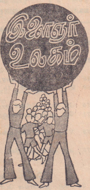
நவ்வாழ்த்துக்களுடன், அன்பு நெஞ்சன், வி. பி.

அ. ம. தி. குருமடம் கொழும்புத்துறை. 1-12-1989