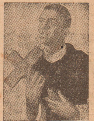
அர்ச். பட்டத்தின் இறுதிக்கட்டம்

இக்கூட்டத்தில் கத்தோலிக்க ரல்லாத பார்வையாளரைப் பொதுச் சங்கத்திற்கு அழைப்பதா இல்லையா என்பது விவாதிக்கப்படும். யாரை அழைப்பது, எம்முறையில் அழைப்பது என்பன நிர்ணயிக்கப்படும். இக்குழுவின் விவாதப்பொருள் மேன்மை தங். கர்த்தினால் பெயர் ஆண்டகையால் தயாரிக்கப்பெற்றது. வரும் ஜனவரித் திங்கள் முதல் இம் மத்தியக் குழு ஒவ்வொரு மாதமும் கூடி விவாதிக்கும்.