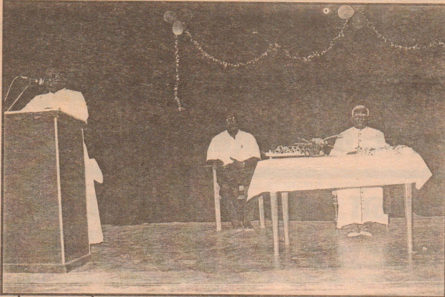
யாழ். மறைமாவட்ட நிலைய 8 மாதகால பயிற்சியை முடித்து சான்றிதழ் வழங்கும் வைபவத்தில் நிலைய இயக்குனர் ஆர்.சி.எக்ஸ். நேசராஜா அடிகள் உரையாற்றுகிறார். யாழ். ஆயர் மேதகு தோமஸ் சவுந்தரநாயகம் ஆண்டகையும் மறையாசிபர் திரு எஸ். செளந்தரமும் மேடையில் இருக்கின்றனர்.