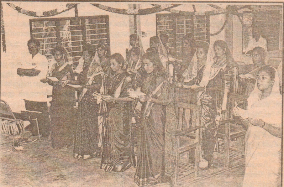
மறைக்கல்வி நடுநிலைய விழாவின்போது திருப்பலியில் பங்குபற்றிய ஒரு பகுதியினர்