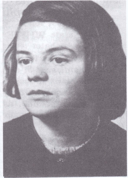
சோபி ஸ்கொல், பிறப்பு 9.5.1921, சிறை 18.2.1943, மரணதண்டனை 22.2.1943