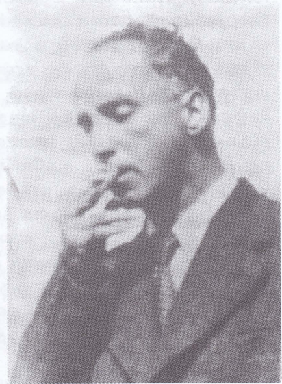
குர்த் கியூபர், பிறப்பு 24.10.1893, சிறை 27.2.1943, மரணதண்டனை 13.7.1943