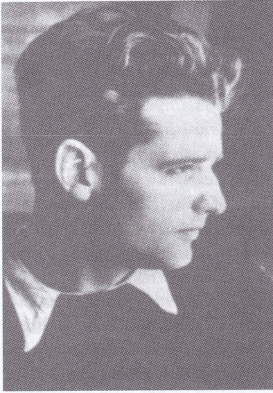
ஹான்ஸ் ஸ்கொல், பிறப்பு 22.9.1919, சிறை 18.2.1943, மரணதண்டனை 22.2.1943