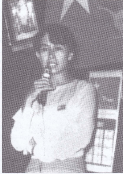
ஒளங்சன் கு கீ 1988-89 ஆண்டுகளில் ஆற்றிய ஆயிரத்துக்கு மேலான பொது மேடைப் பேச்சுக்களில் ஒன்று

ஒளங்சன் கு கீக்கு 1991 ஆம் ஆண்டின் சமாதானத்துக்கான நோபல் பரிசு வழங்கப்பட்டது. எனினும், அதைப் பெற்றுக் கொள்ளும் நற்பேறு அவருக்கு கிட்டவில்லை; காரணம், 1989 ஆம் ஆண்டிலிருந்து அவர் வீட்டுத் தடுப்புக்காவலில் வைக்கப்பட்டிருந்தார். இது அந்நாட்டின் இராணுவக் கட்டளையின்படி நடந்தது. ஒளங்சன் கு கீ, பர்மா என்று அழைக்கப்பட்டு வந்த மியன்மா நாட்டின் தேசிய ஜனநாயக கூட்டணியின் முன்னை நாள் தலைவராக இருந்தவர். 1988 ஆம் ஆண்டில் நடந்த தேர்தலில் பெரும்பான்மை வாக்குகளினால் அமோக வெற்றியீட்டி பதவிக்குத் தெரிவானார். எனினும் பதவியை ஏற்கும் வாய்ப்பு இவருக்குக் கிடைக்கவேயில்லை. காரணம், இராணுவம் தலையிட்டு தேர்தல் முடிவுகள் செல்லுபடியாகாமல் செய்து கொடுங்கோல் குழுவின் ஆட்சி முறையையும் நாட்டில் திணித்தது. 1990 டிசம்பர் 10 ஆம் திகதி மியன்மாவிலுள்ள பல்கலைக்கழகங்கள் பலவற்றைச் சேர்ந்த மாணவர்கள் ஆர்ப்பாட்ட் ஊர்வலங்களை நடாத்தினார்கள். எதிர்க்கட்சியின் அரசியல் நடவடிக்கைகளைத் தடை செய்து வதற்கு எதிராகவே அந்த ஊர்வலங்கள் நிகழ்ந்தன. ஆர்ப்பாட்டக் காரர் குகீயை விடுதலை செய்யும்படி கோரினார்கள். கொடுங்கோல் ஆட்சிக்குழு நாடு முழுவதிலுமிருந்த பல்கலைக் கழகங்களையும் கல்லூரிகளையும் மூடி விட்டதுதான் இதற்கு எதிர் நடவடிக்கையாகும். கு கீயின் இரண்டு கட்டுரைகளிலிருந்து எடுக்கப்பட்ட பகுதிகள் கீழே தரப்பட்டுள்ளன. முதலாவது கட்டுரையின் தலைப்பு "அச்சத்திலிருந்து விடுதலை" என்பதாகும். இதில் ஜவஹர்லால் நேரு ஒரு சமயம்