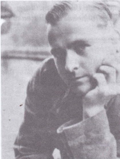
வில்லி கிறாப், பிறப்பு 2.1.1918, சிறை 18.2.1943, மரணதண்டனை 12.10.1943