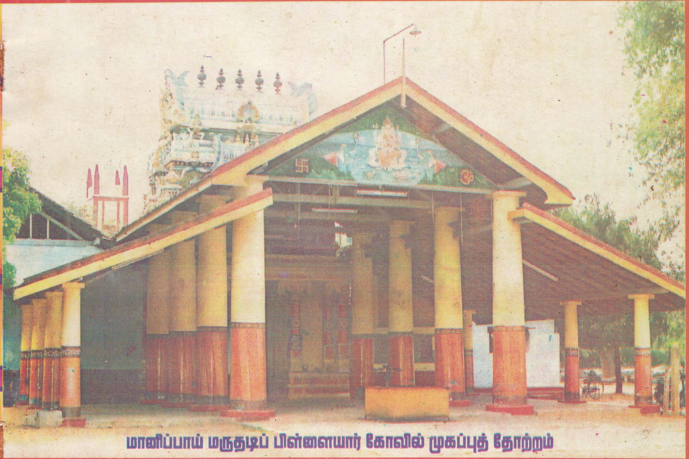
மானிப்பாய் மருதடிப் பிள்ளையார் கோவில் முகப்புத் தோற்றம்