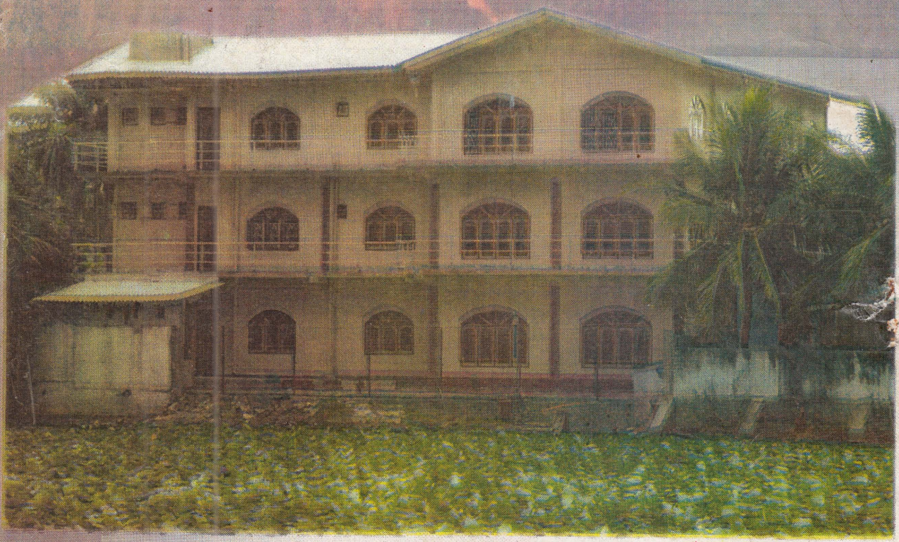
சுகில இலங்கை இந்து மாமன்றம் யாழ் குடாநாட்டில் தமது பணிகளை நிறைவேற்றுவதற்காக சினைக்கப்பட்டு வரும் நவீன கட்டிடத்தின் சில பகுதிகள்