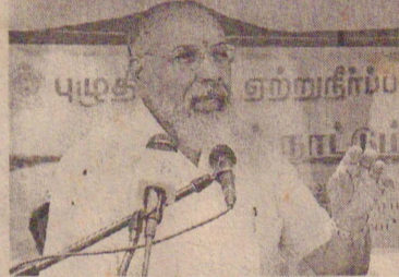
(யாழ்ப்பாணம்) மத்திய அரசாங்கம் வட மாகாண

சபைக்கான 4 கோடி ரூபாவை முடக்கிவைத்துள்ளது என்று வடக்கு மாகாண சபை முதலமைச்சர் சி.வி. விக்கிளேஸ்வரன் குற்றச்சாட்டியுள்ளார். கிளிநொச்சி வட்டக்கச்சி புளூதி ஆறு ஏற்று நீர்ப்பாசன திட்டத்தொடக்க விழா நேற்று வட்டக்கச்சியில் சிறப்பு நடைபெற்றது. வட மாகாணசபையின் திட்டத்தின் கீழ் வட மாகாண விவசாய கமநலசேவைகள் கால்நடை அபிவிரு