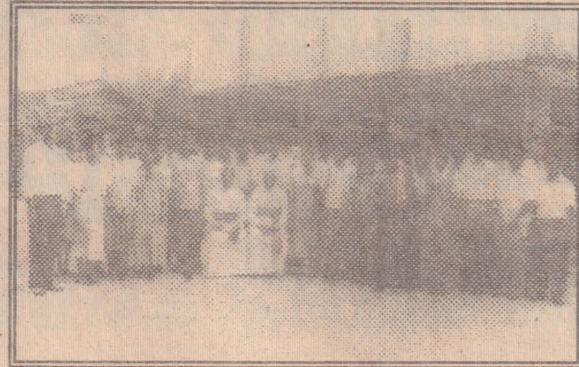
ஆயருடன் மகிழ்ந்து நிற்கின்றனர் பயிற்சியாளர்கள்.

அடுத்து, இது போன்ற நல்ல ஆக்கபூர்வமான செயற்பாடுகளை யாழ் மறை மாவட்ட சமூகத் தொடர்பு சாதன ஆணைக்குழு மின்னி மறையும் மின்னலைப் போன்று இருந்துவிட்டு எப்போதாவது நடத்தாது அடிக்கடி நடத்துதல் ஆக்கபூர்வமான மனிதர்களை வளர்த்தெடுக்க உதவும். அதன் மூலம் எமது யாழ் திருச்சபைக்கு பல கத்தோலிக்க படைப்பாளிகளை உருவாக்கி வழங்க முடியும்.