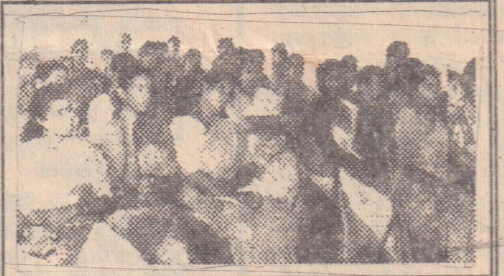
உரைக்கு செவிமடுக்கும் முன்பள்ளி ஆசிரியர்கள்