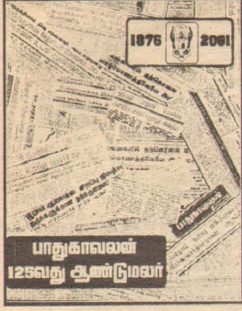
பாதுகாவலன் 125வது ஆண்டுமலர்