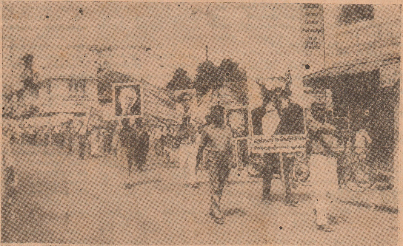
புரட்சிக் கம்யூனிஸ்ட் சமூகத்தின் மீதான ஊர்வலம்

அடுத்த இதழ் முதல் 12 பக்க 'கம்கறு மாவத்த'