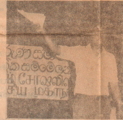
இளம் சோசலிசட்டுகளின் தேசிய ம

பழைய லங்கா சமசமாஜக் கட்சியின் பிரபல்யம் மிக்க குலைப்பு வாதியும் இரண்டாம் உலக யுத்தத்தின் பின்னர் இந்திய போர்ஷிவிச வெளிவிசக் கட்சியை (இந்தியாவில் அன்றைய நான்காம் அகிலக்கிளை) ஜெடப்பிரகாஷ் நாராயணனின் பிரஜா சோசலிசட் கட்சியுள் சேர்ந்து விட பொறுப்பாய் இருந்தவரும், சமசமாஜக் கட்சி இழைத்த பெரும் தவறு அது நான்காம் அகிலத்தில் சேர்ந்ததே என பிரகடனம் பரகடனம்