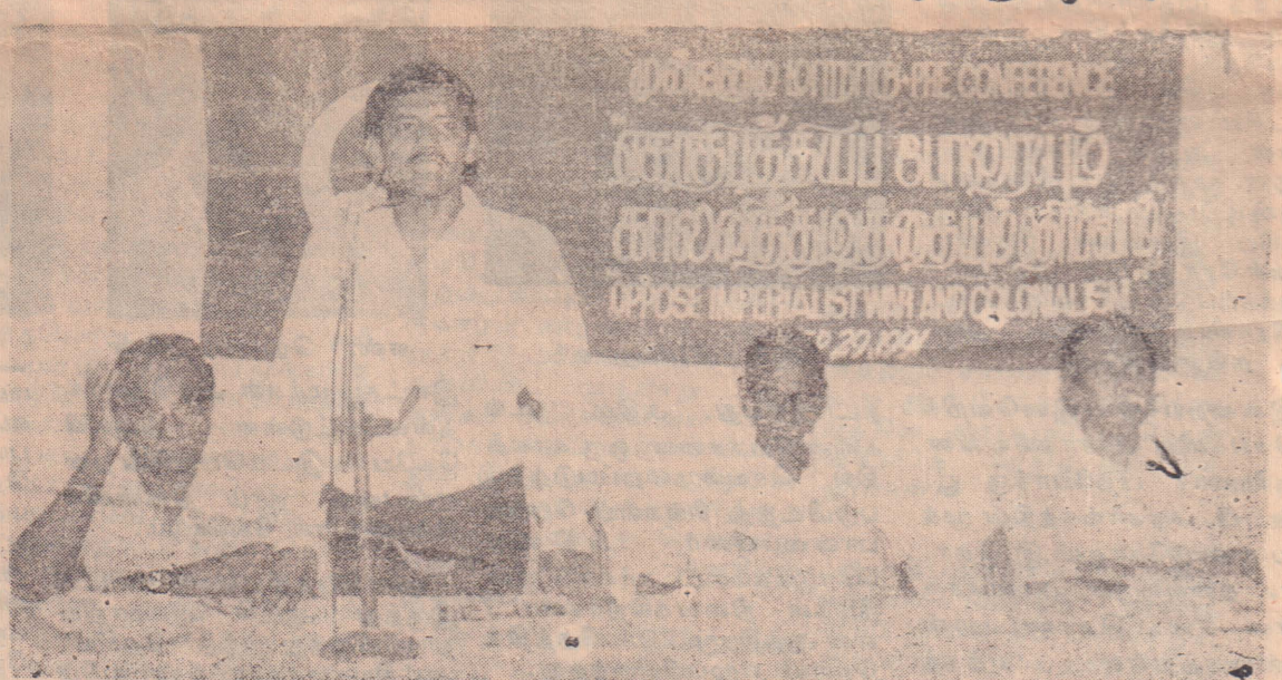
போர்னின் தொழிலாளர் மகாநாட்டிற்கு முன்னோடியாக இந்திய சோ. தொ. க. நடாத்திய மகாநாடு.

இந்திய சோ. தொ.க. தின் 'தொழிலாளர் பாதை' 1991 நவம்பர் இதழின் முதல் பக்க தலைப்புச் செய்தி இவ்வேலை நிறுத்தம் பற்றி கூறுவதாவது: "நரசிம்மராவின் சிறுபான்மை அரசாங்கத்தைக் கவிழ விடாது ஒருபுறம் காப்பாற்றி கொண்டும், மறுபுறம் அதன் புதிய பொருளாதாரக் கொள்கைக்கு எதிராகத் திரண்டு எழுந்து வரும் தொழிலாளர்கள், விவசாயிகள். மற்றும் ஒடுக்கப்படும் மக்களின் போராட்டங்களைக், கட்டுப்படுத்தும் நோக்கத்துடன் அறிந்தது வழிகாண - சி. பி. ஜெ. ஸ்டாலினிசக் கட்சி தின் புதிய பொருளாதாரக்